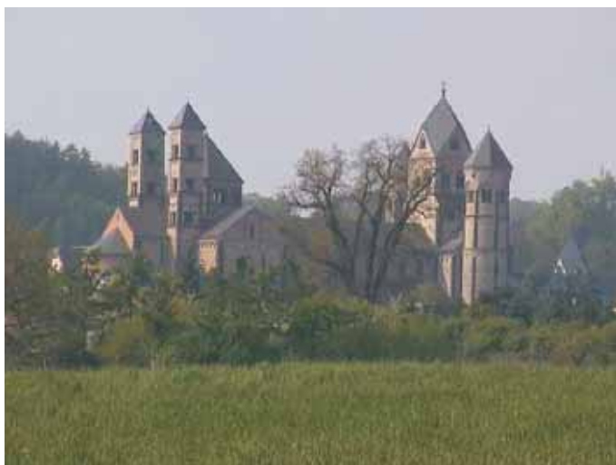
Benediktinerabtei Maria Laach