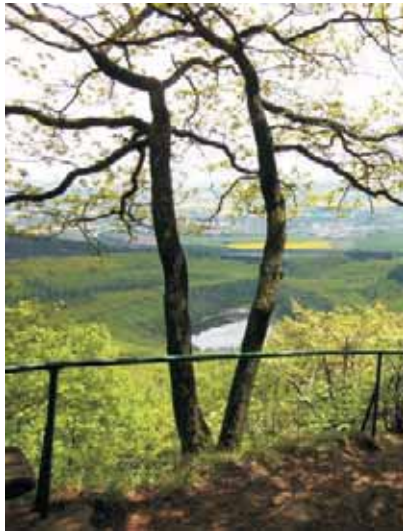
Blick von der „Teufelskanzel“ auf den Krufter Waldsee